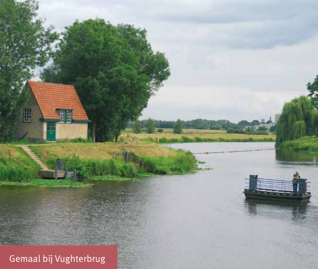
Gemaal bij Vugtherbrug