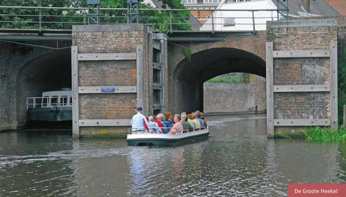
De Grootte Heekel