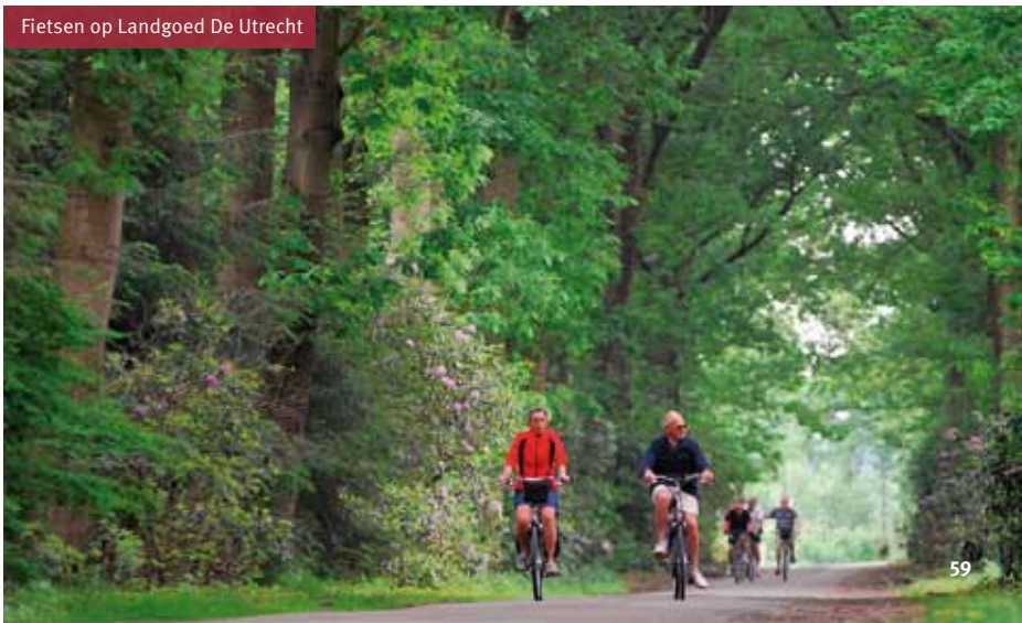
Fietsen op Landgoed De Utrecht

www.vvvhilvarenbeek.nl/natuur/de_utrecht.htm